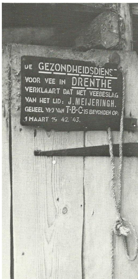
Figuur 2. Jan Was (Meiringh) Brinkstraat 16 heeft op zijn deur het bewijs dat zijn veestapel vrij is van T.B.C.

In de loop van de vijftigerjaren ging men ook in Anloo over op K.I. (kunstmatige inseminatie). Er werd gezamenlijk een Coöperatieve K.I.-vereniging opgericht. De stieren waren gestald in Gieten. Als een boer in Anloo dan een tochtige (vruchtbare) koe had, werd deze opgegeven bij smid Stadman (er was toen nog vrijwel geen boer die al zelf een telefoonaansluiting had). Deze belde dit door naar Gieten en vervolgens kwam de inseminator (ook wel de bol genoemd) om de betreffende koe te behandelen. De datum en de naam van de stier werden op een kaart (K.I.-kaart) vermeld.