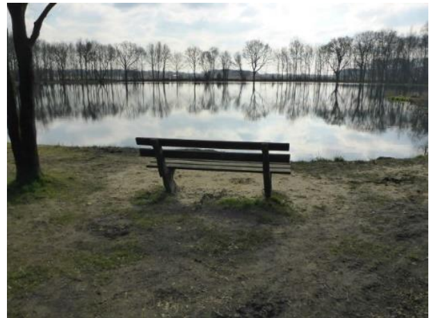
Figuur 3. Visplas, Galgwandenveen.

Teruglopen en eerste bospad links. Daarna door het smalle bospaadje en de kuil van de voormalige zandafgraving naar het Galgwandenveen (Eexter visplas), met vijf grafheuvels uit de Bronstijd (Rijksmonument 45020) en karrensporen.