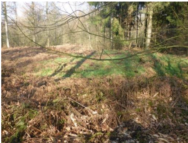
Figuur 2. Enkele grafheuvels.

Doorlopen door het klaphek en het rooster naar de heide (met de heideschapen en heidekoeien, naar twee grafheuvels (Rijksmonument 45019).