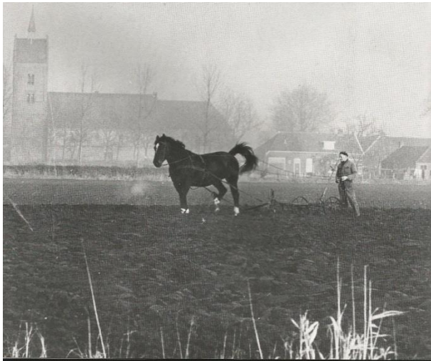
Figuur 2. Harm Smeenge (Brinkstraat 11) aan het cultivateren.

wipkar stond. Met een gierpomp werd de tank geladen. Het pompen gebeurde ook met de hand. De pomp raakte nogal eens verstopt en de prop moest dan met de hand worden verwijderd. Lekker luchtje dus aan de handen. Vervolgens werd het land gecultiveerd en geploegd om het klaar te maken voor het zaaien en poten.