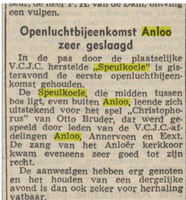
Figuur 2. Nieuwsblad van het Noorden, 3 juli 1952.