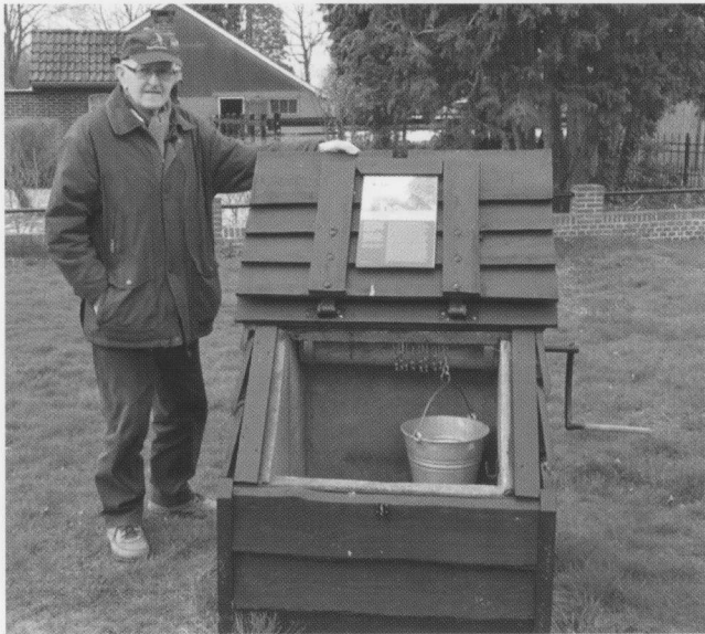
De drinkwaterput in Anloo

Met al die inkomsten kon de Boermarke goede dingen doen voor het dorp en de gemeenschap. Er werd turf gegeven aan de scholen, zodat de kinderen er warmpjes bijzaten in de winter. Er werden lindebomen geplant ten behoeve van de bijenteelt. In 1937 werden er