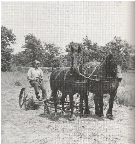
Figuur 1. Jan Boelens met zijn tweepaards maaimachine.

In juni brak de hooitijd aan. Het gras werd toen al gemaaid met een 1-of 2 paards maaimachine. Geert Stenveld ging ook wel maaien bij boeren met zijn maaimachine. Al snel werd het grasmaaien uitbesteed aan loonwerkers met een trekker met maaibalk. O.m. door Fok Winter uit Gasteren, Gezienus Brands uit Annen en Lambertus Boer uit Anloo. Na het maaien moest het zwad worden gekeerd en naar gelang de weersomstandigheden werd het hooi 2 a 3 keer geschud. Daarna werd het hooi op (zweel) geharkt en geopperd. Liepen de weersomstandigheden tegen dan werd er tussentijds geopperd in kleine hoopjes, die later als weer beter was weer over het land werden verspreid. Ook werd er in die tijd wel gebruikgemaakt van ruiters. Het hooi werd hier opgezet en kon zo drogen. Regenwater trok niet in het hooi. Als het hooi droog was werd het op de wagen of wipkar geladen en naar de boerderij