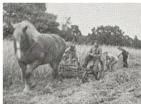
Figuur 6. Fam. J.Klamer in de roggeoogst.

Ook dit ging nog wel eens fout met als gevolg een reprimande. Ook kreeg de bultzetter wel eens de scherpe achterkant van de schoof in het gezicht. Dan was de gort helemaal gaar.