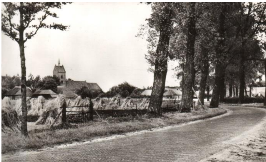
Figuur 3. Rogge hokken langs de Gasterenseweg.

werden door ons ontvangen van de opstecker en doorgegeven aan de bultzetter. Dit moest zodanig gebeuren dat hij de schoof zonder hem te moeten draaien kon neerleggen.