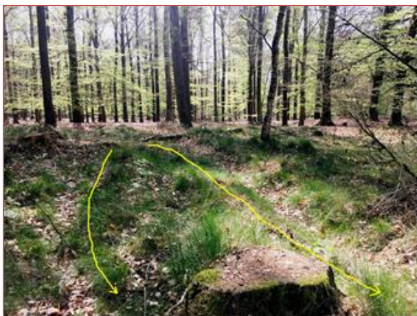
Figuur 3. Contouren van oude Middeleeuwse karrensporingen nabij het Galgwanderveen.

decimeter nauwkeurig hoogteverschillen zichtbaar te maken die je met het blote oog niet ziet. Als we vervolgens inzoomen op het Evertsbos en de presentatielaag ‘maaielhoogete’ kiezen, dan zien we ineens prachtige details van het oppervlak waar nu metershoge bomen staan.