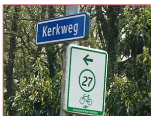
Figuur 1. De Kerkweg door het Evertsbos, een oude reeweg.