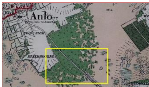
Figuur 2. Fragment van historische kaart; de uitsnede (rechthoek) correspondeert met de in figuur 2 getoonde maaiveldhoogtekaart.

Ter hoogte van het meertje stootten we echter op een enorme modderpoel. Van de reeweg was niets meer over. Alom met regenwater gevulde diepe geulen.