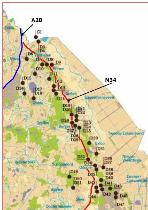
Figuur 1. Hunebedden langs de N34.

worden. Uiteraard werden ze gebruikt voor transport en prehistorische begrafenisrituelen, maar ze dienden ook als communicatienetwerk tussen dorpen en nederzettingen en verbindingen met andere gebieden buiten het Drentse gebied.