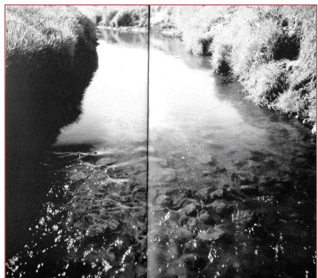
Figuur 3. Voorde in het Gasterensiediep.

In het Drentsche Aa gebied vind je die ook nog terug bij de Gasterense Duinen en Anloo (Anloërdiepje), en in het Balloërveld (Gasterensiediep, zie foto).